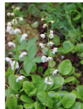
Apskritalapė kriaušlapė ( Pyrola rotundifolia )