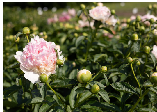
Puikūs bijūnas ( Paeonia lactiflora ) 'My Love'

apskritalapė kriaušlapė ( Pyrola rotundifolia ) dirvinis bobramunis ( Anthemis arvensis ) dirvinis godulis ( Anchusa arvensis ) gauruotoji poavižė ( Helictotrichon pubescens ) kalninis dobilas ( Trifolium montanum ) karčioji šiušelė ( Erigeron acris ) kiškio ašarėlės ( Briza media ) krūminis builis ( Anthriscus sylvestris ) liekninis viksvameldis ( Scirpus sylvaticus ) mažasis barškutis ( Rhinanthus minor ) paprastasis garždenis ( Lotus corniculatus ) paprastasis putinas ( Viburnum opulus ) paprastoji baltagalvė ( Leucanthemum vulgare ) paprastoji šunažolė ( Dactylis glomerata ) pelkinė kreisvė ( Crepis paludosa ) pievinis katilėlis ( Campanula patula ) puokštinė poraistė ( Lysimachia thysiflora ) siauralapė žliūgė ( Stellaria graminea ) siauralapis gyslotis ( Plantago lanceolata ) šilinis dobilas ( Trifolium medium ) šilkažiedė gaisrena ( Silene flos-cuculi ) skiauterėtoji putokšlė ( Polygala comosa ) švelnioji dirsė ( Bromus hordeaceus ) trispalvė našlaitė ( Viola tricolor ) vaistinis godas ( Anchusa officinalis ) valgomoji rūgštyinė ( Rumex acetosa ) varpotoji glaudenė ( Phyteuma spicatum ) vienametė klėstenė ( Scleranthus annuus ) vienažiedė snaudalė ( Leontodon hispidus )