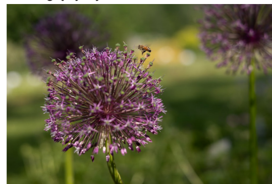
Česnakas ( Allium ) 'Purple Sensation'