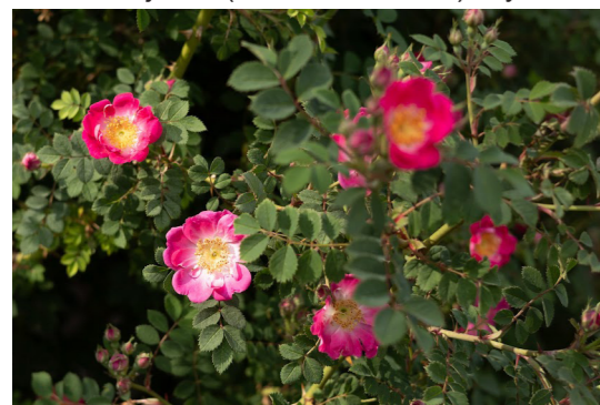
Erškėtis ( Rosa moyesii ) 'Eoss'