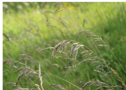
Gauruotoji poavižė ( Helictotrichon pubescens )