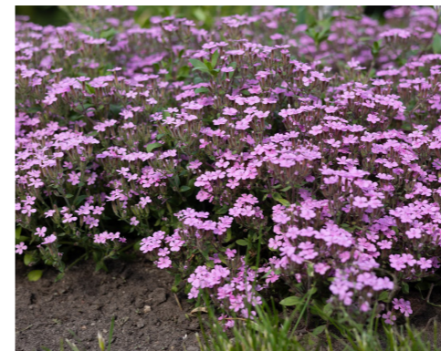
Bazilikinis putoklis ( Saponaria ocymoides L.)