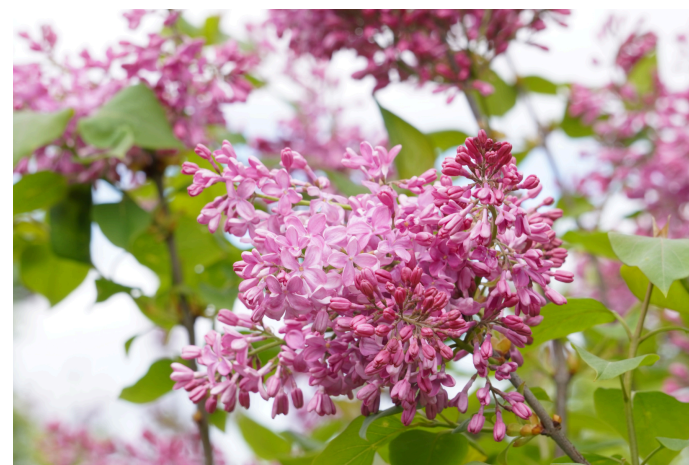
Hiacintinės alyvos ( Syringa x hyacinthiflora ) 'Buffon'