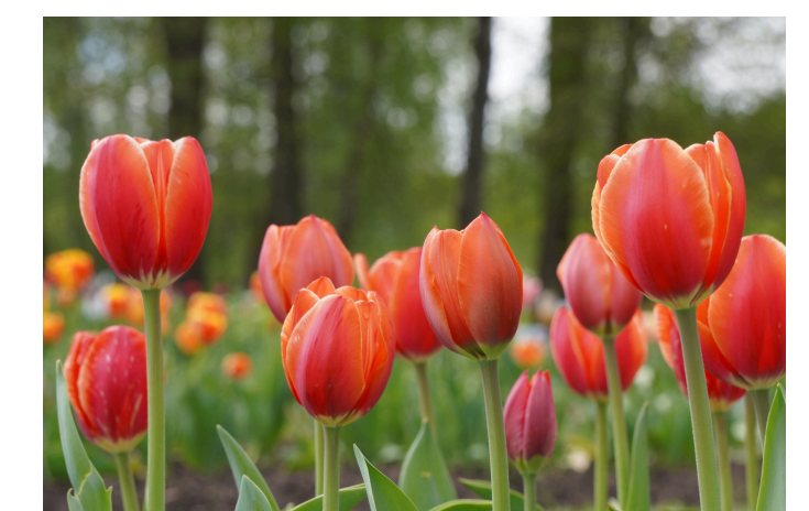
Tulpės ( Tulipa ) 4 'Eric Hofsjö'